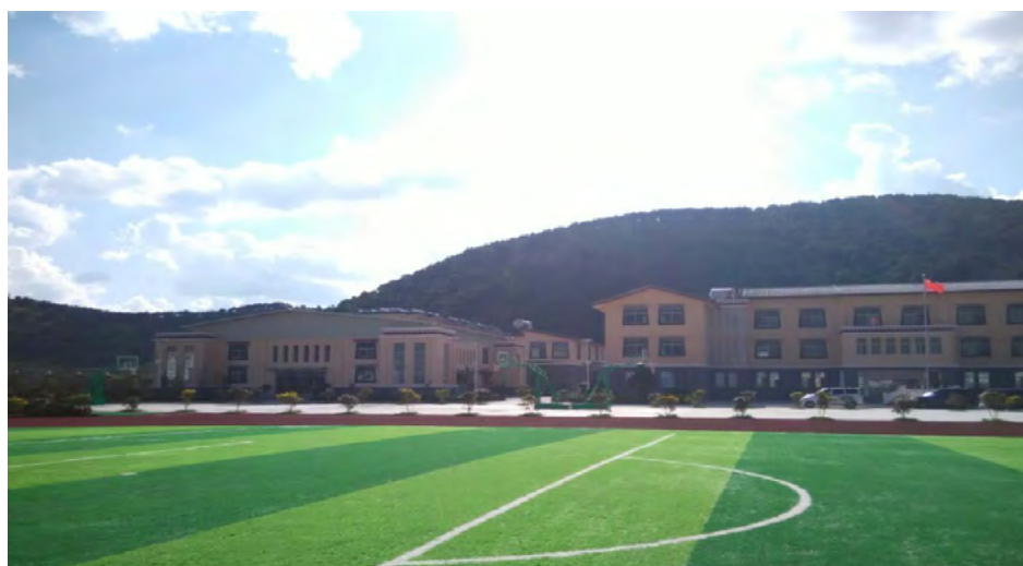
香格里拉一中 / 香格里拉民族中学 / 独克宗小学