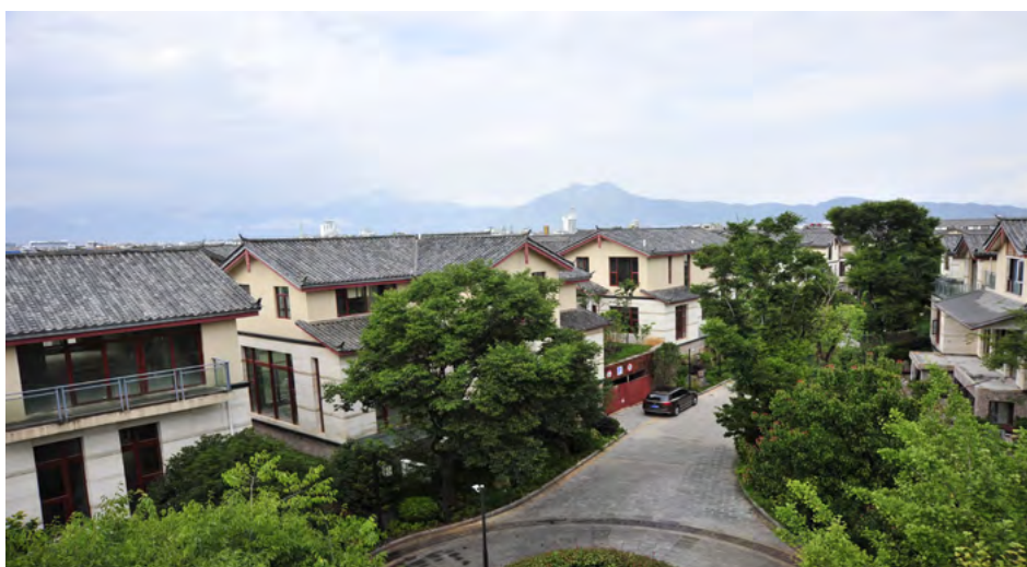
丽江市花马溪谷二期