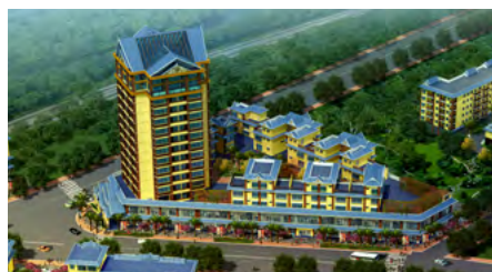
傣族民族建筑风格建筑