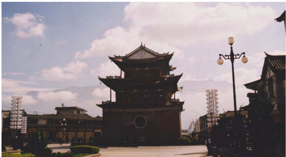
白族民族建筑风格