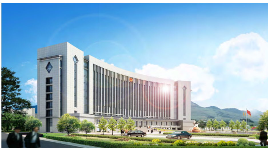
元阳县人民法院 / 丽江市直机关综合办公楼会议中心