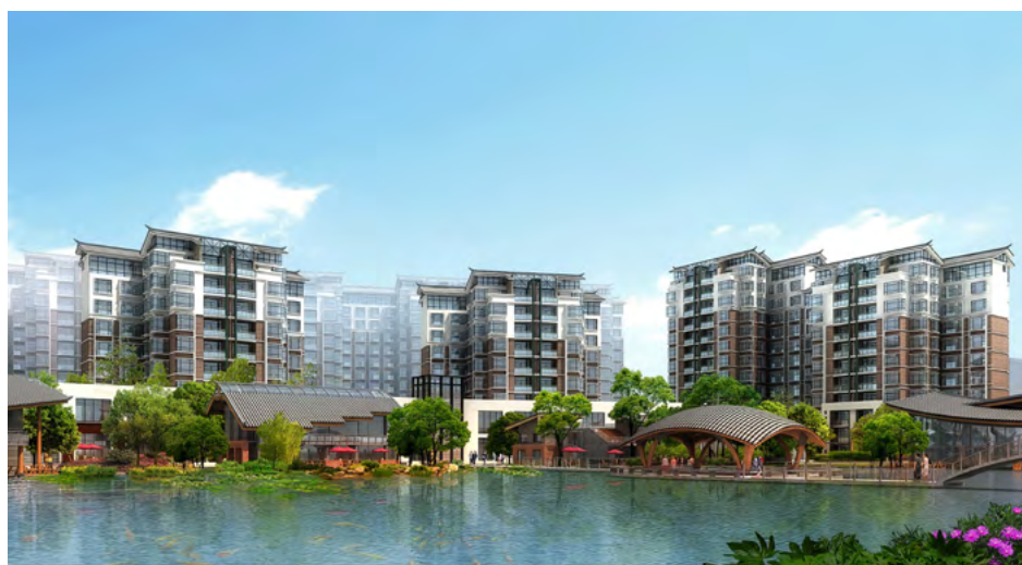
丽江“锦上城”高尚住宅小区