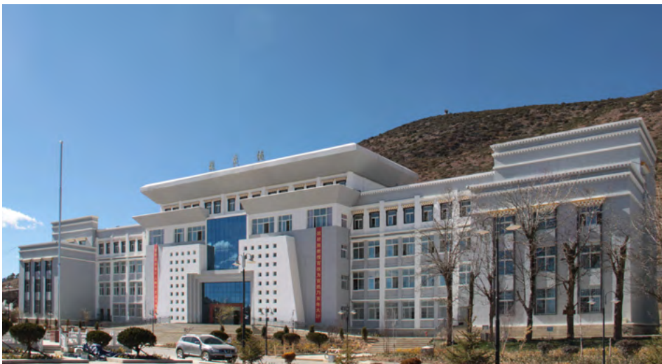
藏式民族建筑风格